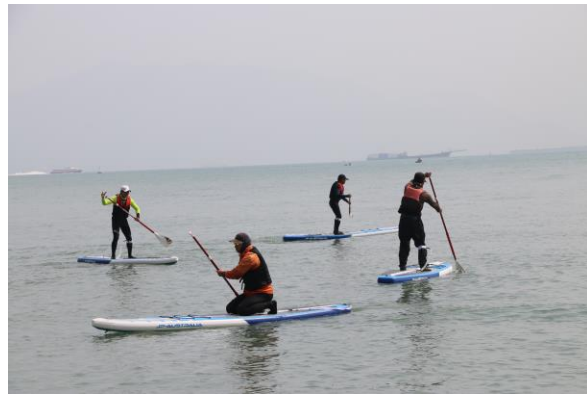
立划艇(Stand Up Canoe)